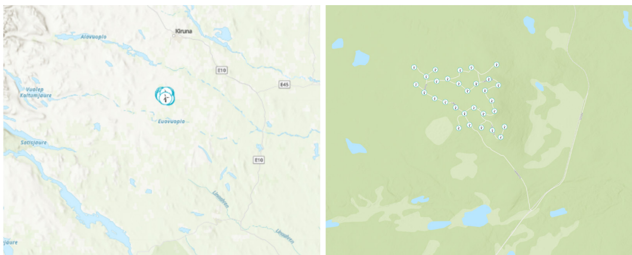
Figur 2. Karta över området i Lappland samt inzoomat över området med vindkraftverk.

Kartan i Figur 2 visar området där elnätet och vindkraftparken finns.